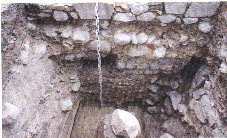
Ryc. 3. Zdjęcie 1. Wykop 2. Widok od S na lico południowej ściany kruchty ulokowanej między zakrystią i korpusem świątyni (II faza). Po prawej stronie widoczny starszy relikw fundamentu W-N narożnika wieży (I faza).