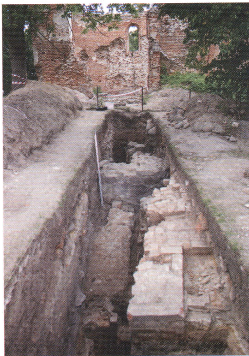
Ryc. 4. Zdjęcie 2. Wykop 3/07. Widok od S. Na dalszym planie ruina kościoła. W wykopie ceglane kanały systemu hipocaustum widoczne wewnątrz domu zamkowego (II faza). Najwyżej posadowione ceglane relikty to podwalina z XVII w.