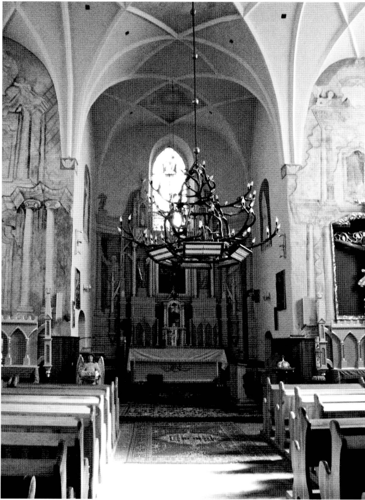
9. Wnętrze kościoła pozakonnego pw. Zwiastowania NMP w Krasnymborze (w zbiorach ROBiDZ Białystok).

Interior of the former monastic church of the Annunciation of the Holy Virgin Mary in Krasnybór (in the collections of ROBiDZ in Białystok).