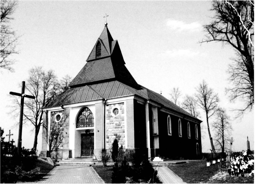
3-4. Kościół pw. św. Rocha w Krasnymborze. Church of St. Roch in Krasnybór.