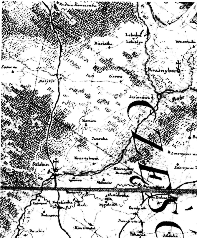
1. Krasnybór i okolice. Fragment Mapy szczególnej województwa podlaskiego (...) Karola de Perthées, 1795. AGAD, Zbiór Kartograficzny, AK 98. Krasnybór and environs. Fragment of Mapa szczególna województwa podlaskiego (...) Karola de Perthées, 1795 (A Detailed Map of the Voivodship of Podlasie [...] by Charles de Perthées), 1795. AGAD, Cartographic Collection, AK 98.

trybunalski 14 . Mając poważanie i ciesząc się wzorową opinią, posłował na sejmy 15 .