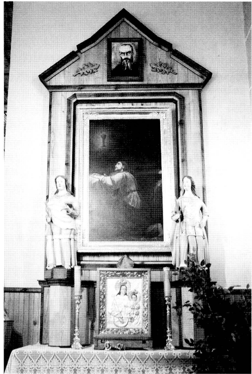
7. Ołtarz boczny z wizerunkiem Pana Jezusa w Ogrójcu w kościele pw. św. Rocha w Krasnymborze (w zbiorach ROBiDZ Białystok). Side altar with a likeness of The Lord Jesus in Gethsamene in the church of St. Roch in Krasnybór (in the collections of ROBiDZ in Białystok).

opisywano jak następuje: Dom nowy, przy nim się także dranicami pobito, do tej sieni drzwi na zawiasach i z wrzeczdzami. Z tej sieni świetlica stołowa, do niej drzwi na zawiasach i za zaszczepeką, ław w niej wielkich dwie, stół, okien w otów 3, piec zielony, przy tym piecu kominek murowany niski. Z tejże izby komora, do niej drzwi na zawiasach z wrzeczdzem, w tej komorze okien dwie sumptu moderni parochi, służby dwie, jedna w komorze, druga w świetlicy.