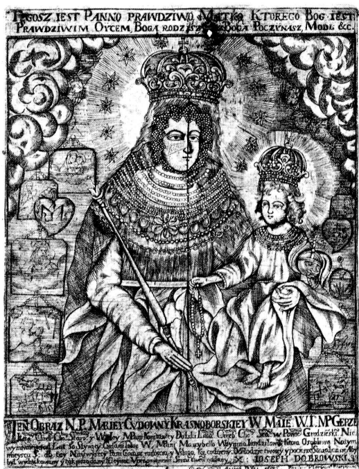
10. Przedstawienie cudownego wizerunku Matki Boskiej Krasnoborskiej wykonane w 1675 roku. Depiction of the miraculous likeness of Our Lady of Krasnybór executed in 1675.