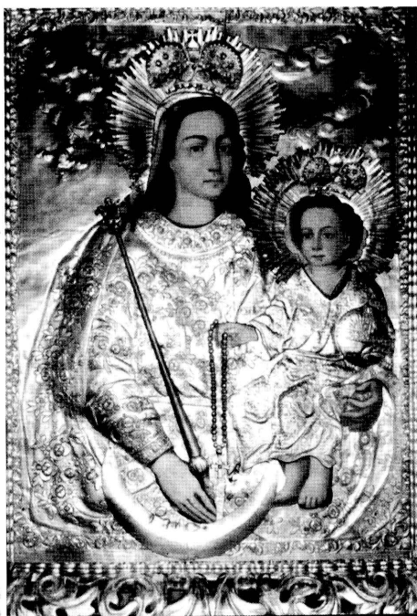
11. Cudowny obraz Matki Boskiej Krasnoborskiej (stan obecny). Miraculous painting of Our Lady of Krasnybór (present-day state).