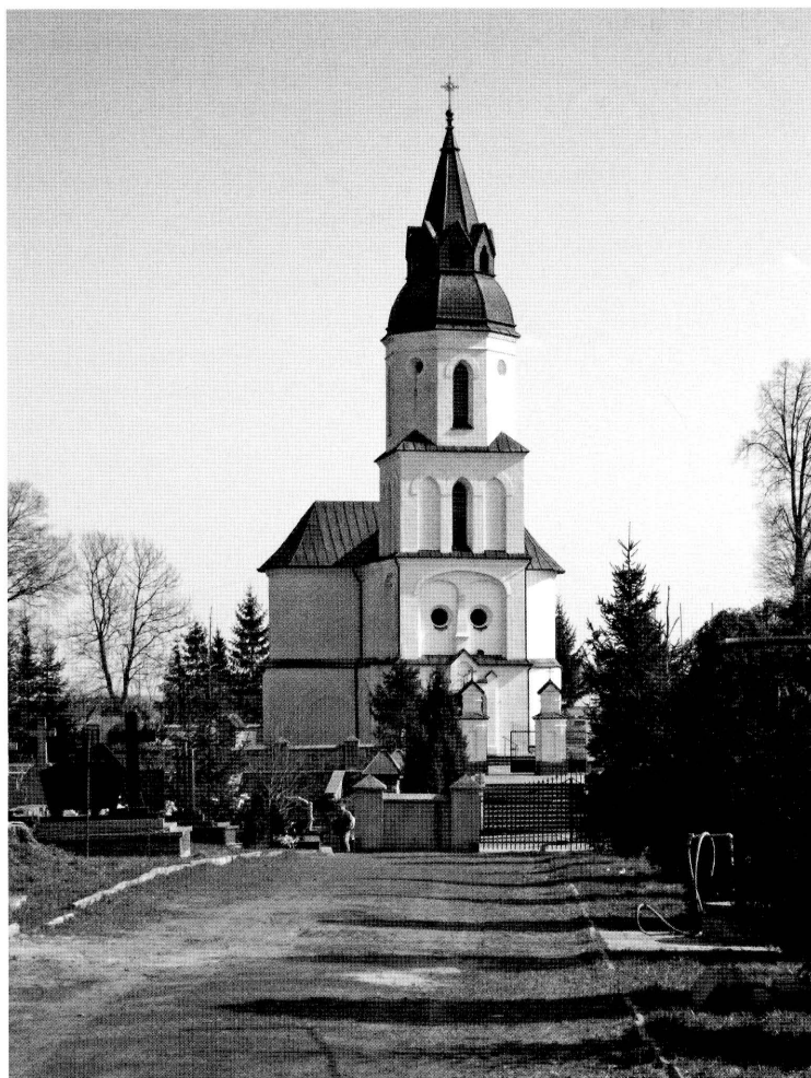
8. Kościół pozakonny pw. Zwiastowania NMP w Krasnymborze (w zbiorach ROBiDZ Białystok).

Former monastic church of the Annun- ciation of the Holy Virgin Mary in Kras- nybór (in the collec- tions of ROBiDZ in Białystok)