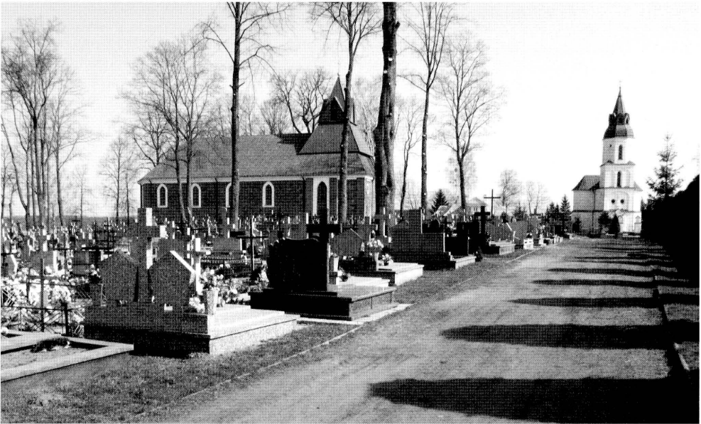
13. Kościół pw. św. Rocha i kościół pozakonny w Krasnymborze (w zbiorach ROBiDZ Białystok). Church of St. Roch and the former monastic church in Krasnybór (in the collections of ROBiDZ in Białystok)