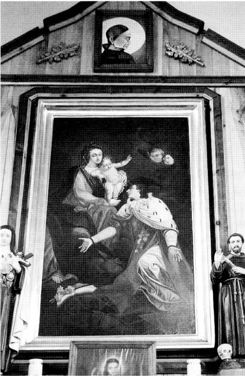
6. Ołtarz boczny św. Kazimierza w kościele pw. św. Rocha w Krasnymborze (w zbiorach ROBiDZ Białystok). Side altar of St. Kazimierz in the church of St. Roch in Krasnybór (in the collections of ROBiDZ in Białystok).