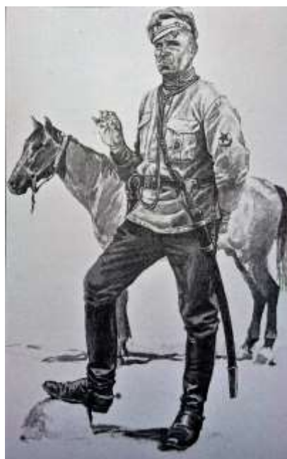
Komisarz polityczny z okresu wojny polsko-bolszewickiej