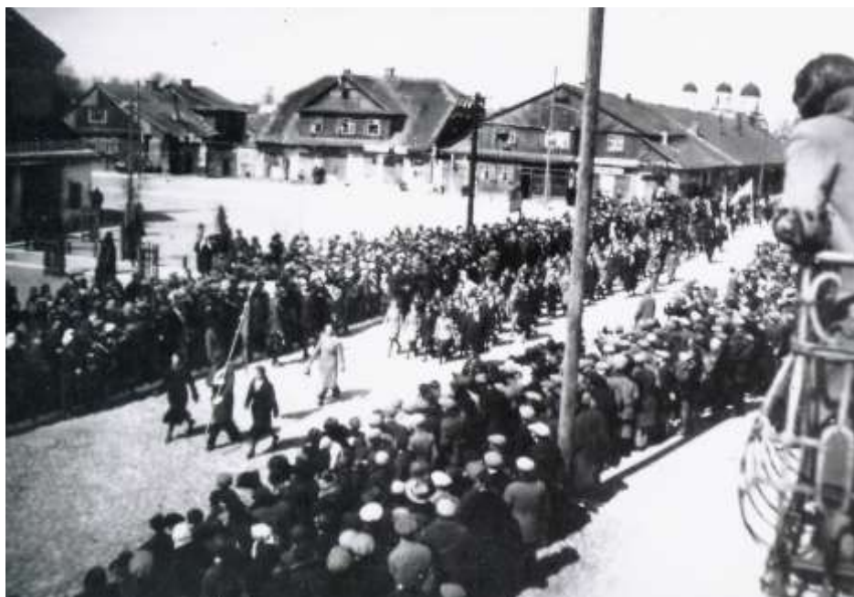
Defilada ul. Mickiewicza z okazji święta 11 Listopada. Na czele poczet sztandarowy LO i gimnazjum. Bielsk Podlaski 1937 r.