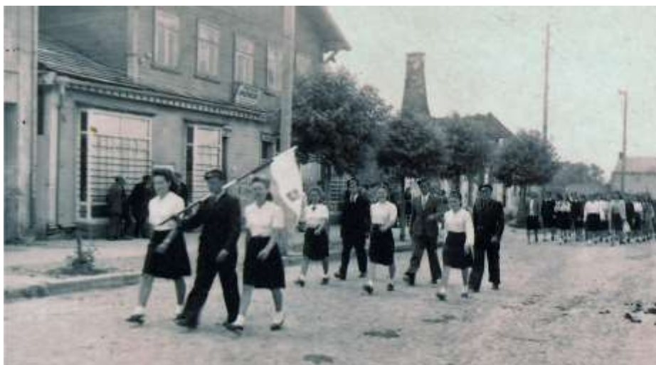
Bielsk Podlaski 7 VII 1946 r. „Ostatni raz idziemy razem do kościoła”