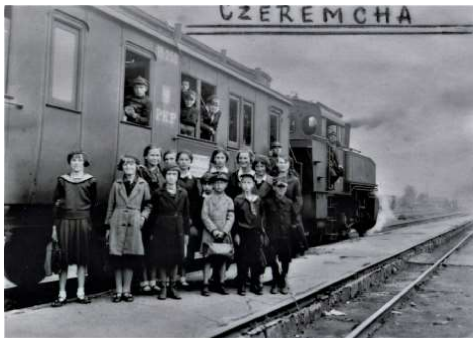
Pociąg kursujący na trasie Czeremcha – Bielsk Podlaski, tzw. „szkolny”, który dowoził młodzież do szkół. Stacja PKP Czeremcha, 1937 r.