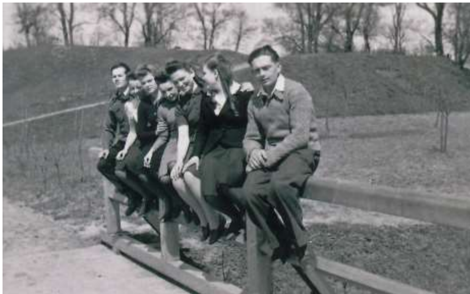
Młodzież z Liceum im. T. Kościuszki w Bielsku Podlaskim na mostku przy „Łysej Górze” (grodzisko). Maturzyści 1946 r.