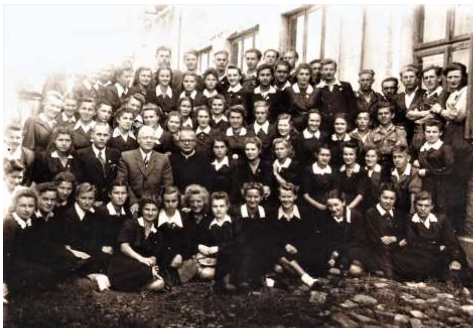
Uczniowie i nauczyciele Liceum im. T. Kościuszki w 1948 r.