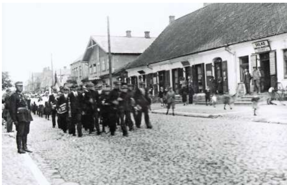
Bielsk Podlaski, ul. Mickiewicza. Rozpoczęcie roku szkolnego w 1934 r. Pochód prowadzi orkiestra dęta Gimnazjum im. T. Kościuszki