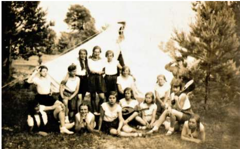
Letni Obóz Przystosowania Wojskowego Kobiet w Kozarówce k. Drohiczyna, 1 VI 1931 r. „Drużyna II” bielskiego gimnazjum